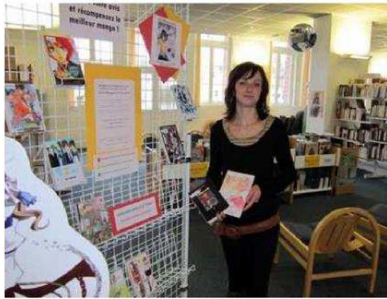
Les jeunes intéressés ont jusqu'au 10 décembre pour s'inscrire au Prix Mangawa à la médiathèque.

représentent les mangas, japonaise. La de devenir juge afin de