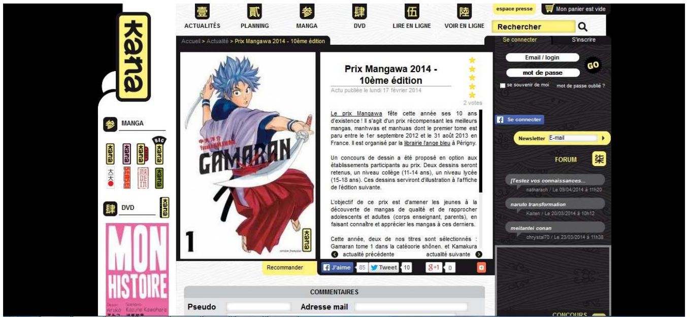
Site Kana – 17 février 2015